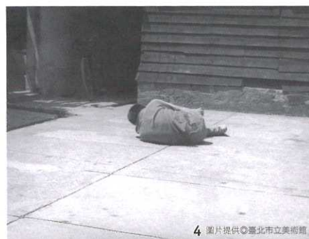
4 圖片提供◎臺北市立美術館