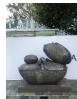
雕塑 3 (船) :