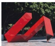
雕塑 1 (紅不讓) :