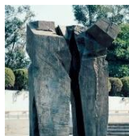
雕塑 2 (太極拱門) :