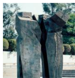
雕塑 2 (太極拱門): 創作者：朱銘 媒材技術：青銅 尺寸：210 x 275 x 375 cm