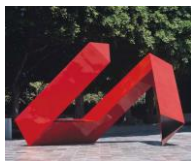
雕塑 1 (紅不讓): 創作者：李再鈞 媒材技術：不銹鋼、烤漆 尺寸：620 x 440 x 229cm